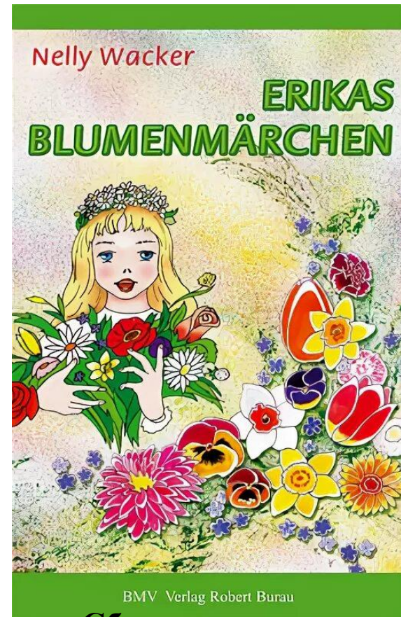
Сборник сказок Нелли Ваккер