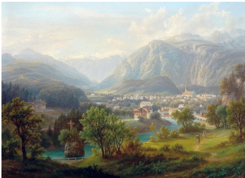
«Kreuzstein in Jainzen» (Österreich)