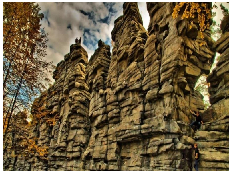
«Рассказ о Чёртовом Городбище»